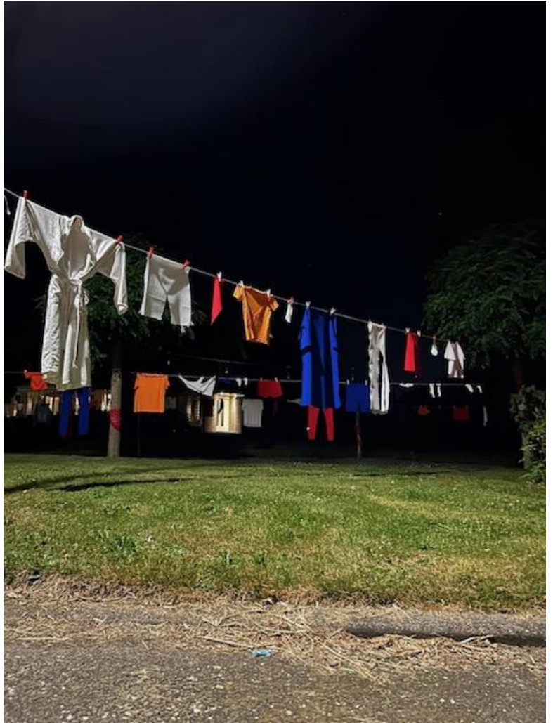
Oranje feestweek 2024