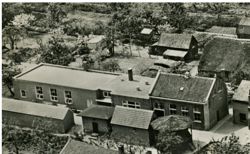
Links met plat dak de nieuwbouw van de huishoudschool. Rechtsonder de muziektent.

Een feit, ik zou haast zeggen een bijzonder en heuglijk feit, mag zeker niet onvermeld blijven. De opening van een christelijke landbouwhuishoudschool aan de Burgemeester van der Schansstraat. Het achterste gedeelte van de Koningshof is nog een gedeelte van