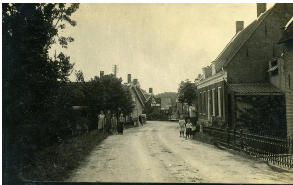
In het midden van de foto staat de benzinepomp van Rüger.

UITERSTE INLEVERDATUM KOPIJ : 2 APRIL 2025